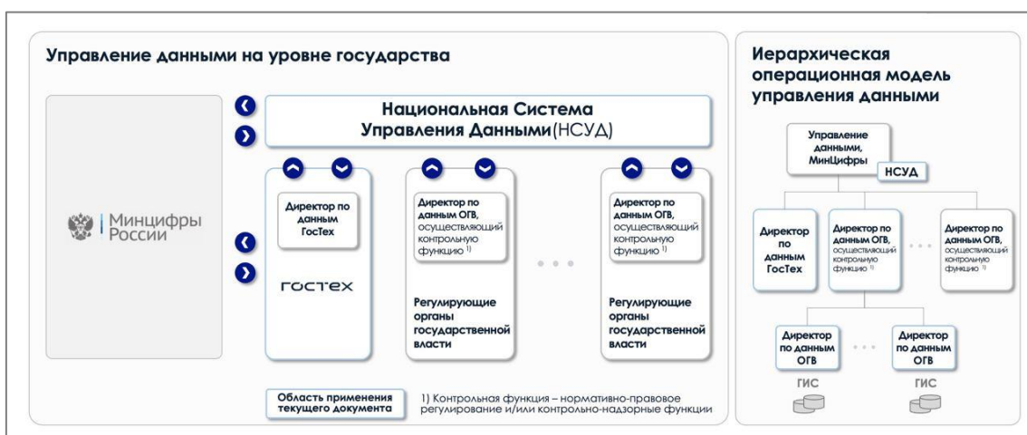
Рис 1. Общая схема управления данными на уровне государства.

Для построения модели управления данными на уровне государства реализуется сквозная иерархическая операционная модель от уровня отдельных ГИС в ОГВ до управления данными на уровне государства. Управление данными на платформе «ГосТех» является частным случаем управления данными на уровне государства. Общая схема операционной модели управления данными на уровне государства представлена на Рис. 1.